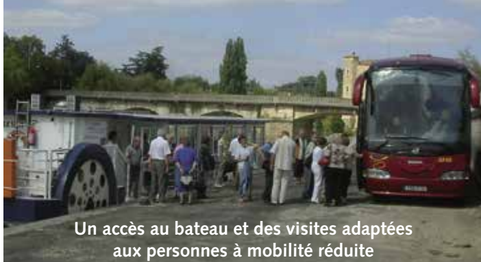
Un accès au bateau et des visites adaptées aux personnes à mobilité réduite

CAPACITÉ D'ACCUEIL : 62 passagers en croisière repas, 75 en croisière promenade